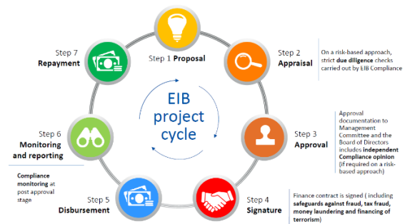
Γράφημα 2 Κύκλος Έργου ΕΤΕπ

Τα έργα που χρηματοδοτούνται από την ΕΤΕπ περιλαμβάνουν συνήθως έργα για τον εκσυγχρονισμό και την επέκταση της υπάρχουσας κοινωνικής και αστικής υποδομής και υπηρεσιών. Αυτό αφορά την τηλεθέρμανση και την ψύξη, τη συμπαραγωγή, την αποκατάσταση και τον εκσυγχρονισμό κτιρίων και τη βελτίωση των βιομηχανικών διαδικασιών, καθώς και τη βελτίωση και την αναβάθμιση των ενεργειακών αξιών των δικτύων αστικών μεταφορών, δίκτυα διαχείρισης αποβλήτων και υδάτων.