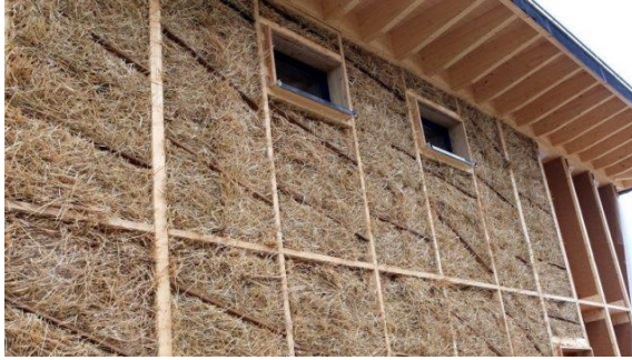
Ανακαίνιση Picardie Pass

Άλλα παραδείγματα χρηματοδότησης από το λογαριασμό στην Ευρώπη: