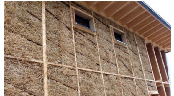
Picardie Pass Rénovation

Autres exemples de financement sur facture en Europe :