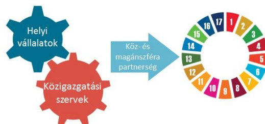
a. ábra A fenntartható fejlődési célok elérése a helyi vállalatok CSR-jén alapuló magánszféra-partnerség keretében

Az éghajlatváltozáshoz való alkalmazkodás és hatásmérséklés beemelése a vállalatok CSR céljai közé lehetővé teszi, hogy ezekre az intézkedésekre minden évben forrásokat különítsenek el. Ha ezek a vállalatok bekerülnek a SECAP érdekelt feleinek csoportjába is, az önkormányzatok nagyobb költségvetéssel gazdálkodhatnak az akciótervek bevezetésénél.