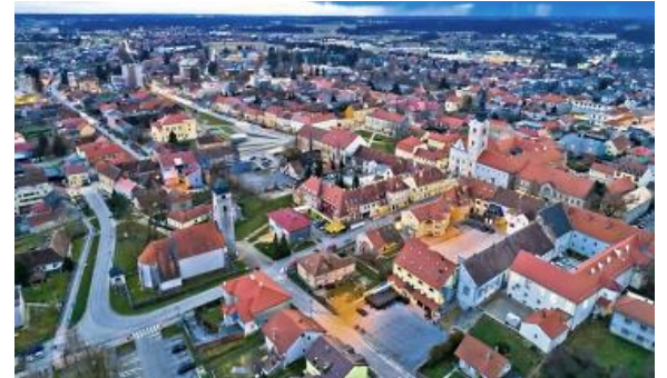
Città di Križevci