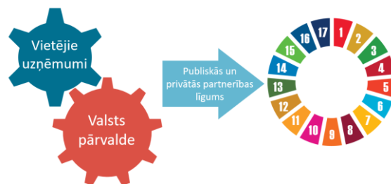
Attēls a. Ilgtspējīgas attīstības mērķu sasniegšana, izmantojot publiskā un privātā sektora partnerības shēmu, kuras pamatā ir vietējo uzņēmumu KSA

Klimata pārmaiņu pielāgošanās un mazināšanas saistību iekļaušana uzņēmumu KSA mērķos nozīmē, ka budžetu šīm darbībām var piešķirt katru gadu. Ja šie uzņēmumi ir arī iesaistīti SECAP ieinteresēto personu grupā, tad vietējās pašvaldības arī var piešķirt lielāku budžetu šo rīcības plānu īstenošanai.