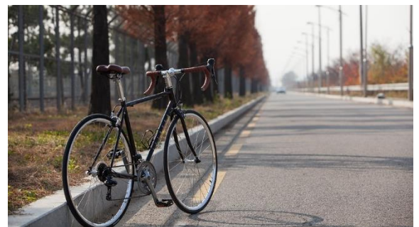
Šī faktu lapa ir daļa no finansējuma iespēju sērijas, kas atrodama šeit: html-link