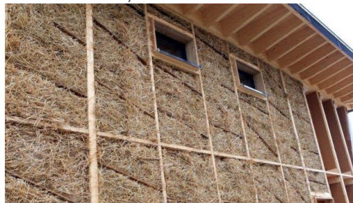
Picardie Pass Rénovation